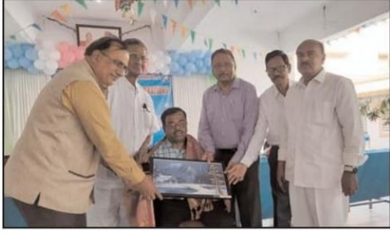
న్యూస్ రీడర్ ప్రతినిధి.